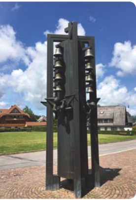
Glockenspiel vor dem Evangelischen Pfarrhaus Hinterzarten, Adlerweg 11

Unten: Die Kirche »Zu den Zwölf Aposteln«, Adlerweg 13 79856 Hinterzarten