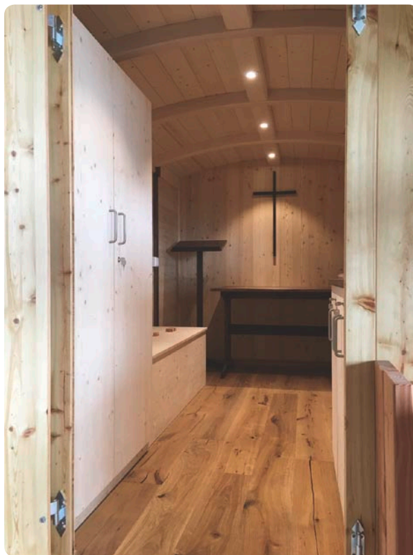
Foto: Schäferwagen von innen

In einem Fest für alle wird im Anschluss an diesem Donnerstag die Gelegenheit sein, die Schäferwagenkirche zu besichtigen und weitere Ideen für ihren Einsatz zu spinnen.