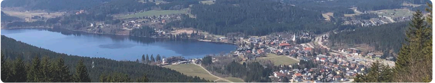
Foto: Blick auf den Titisee

Fürchte dich nicht, denn ich habe dich erlöst! Ich habe dich bei deinem Namen gerufen; du bist mein! (Jesaja 43, 1)