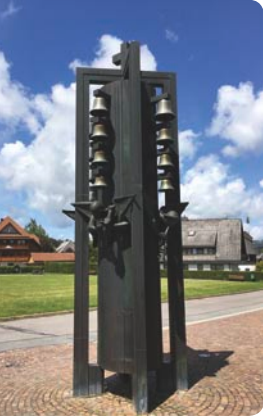
Glockenspiel bei der Kirche »Zu den Zwölf Aposteln«, Hinterzarten, Adlerweg 11,

Kirche (unten) Adlerweg 13 79856 Hinterzarten