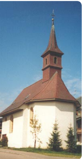
Bärenhofkapelle in Titisee, 79822 Titisee-Neustadt, Kapellenweg, (nach Abfahrt von der B31 gleich rechts ab und wieder rechts in den Kapellenweg)