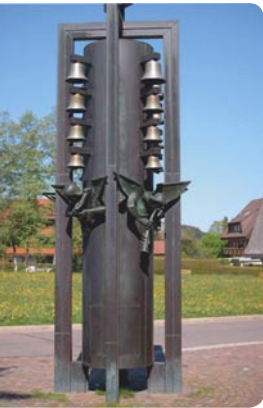
Glockenspiel bei der Kirche zu den 12 Aposteln, Hinterzarten, Adlerweg 13, 79856 Hinterzarten